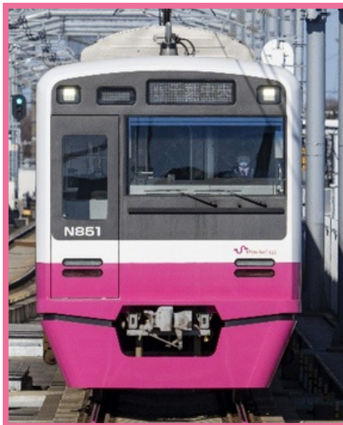
新京成N800形（イメージ）