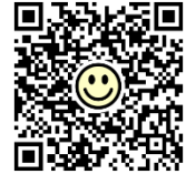
【お申し込みページ二次元バーコード】