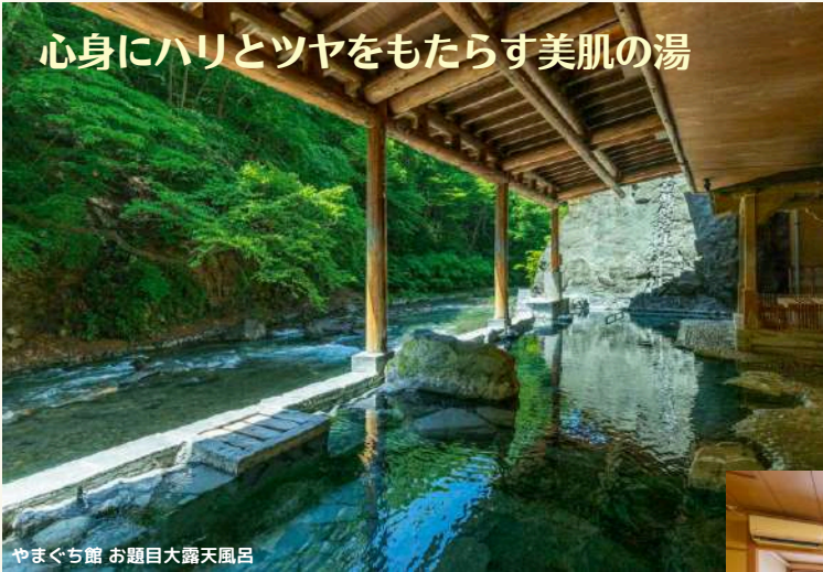
やまぐち館 お題目大露天風呂

四万温泉の効用 一、温泉に含まれる成分が肌にハリとツヤ、透明感を与えてくれます。 二、温熱・水圧・浮力などにより、内臓機能を活発にさせ、さらに筋肉のこりをほぐし疲労回復をうながします。 三、水と緑と温泉に恵まれた四万温泉には、マイナスイオンが多く含まれ、心の安定とやすらぎを得られる作用があります。 【泉質】 硫酸塩温泉 【温度】 50度～58度 【効能】 皮膚の再生、傷の回復、あせも、湿疹、関節・筋肉の痛み、胃腸病・婦人病・体力回復など