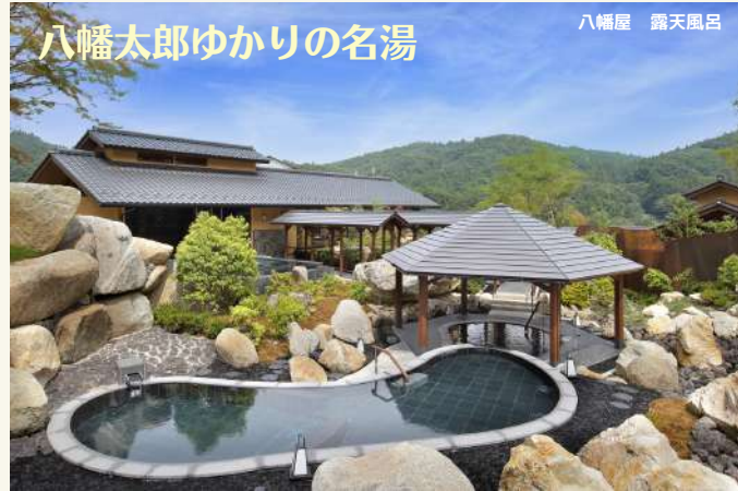
八幡太郎ゆかりの名湯