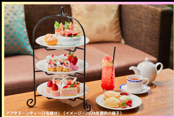
アフタヌーンティー(2名様分) (イメージ・2024年提供の様子)

会場：ダイードリンコアイスアリーナ 出演：プリンスアイスワールドチーム ゲスト：荒川静香、宇野昌磨、織田信成、 田中刑事、本田真凜、 高橋大輔 & 村元哉中 ※その他ゲストは決定次第発表されます。