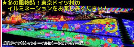
★冬の風物詩!東京ドイツ村のイルミネーションをお楽しみください! 東京ドイツ村のウインターイルミネーション(イメージ)