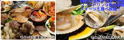
意識は浜焼き食べ放題! フードドリンク飲み放題! スイーツも食べ放題! きよつばち 海鮮(イメージ) きよつばち 焼物(イメージ)

コース 各出発地=○とみうらマート(買物)=◎きよつばち(昼食:海鮮浜焼き食べ放題他)=○道の駅グリーンファーム館山=◎南房総市みかん農園(みかん狩り園内30分食べ放題)=◎東京ドイツ村(イルミネーション観賞)・自由散策=各出発地(最終19:40頃着予定)