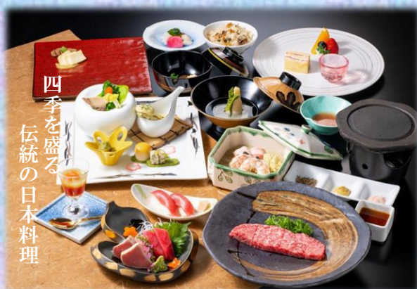
四季を盛る 伝統の日本料理