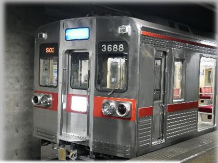
3600形 リバイバルカラー