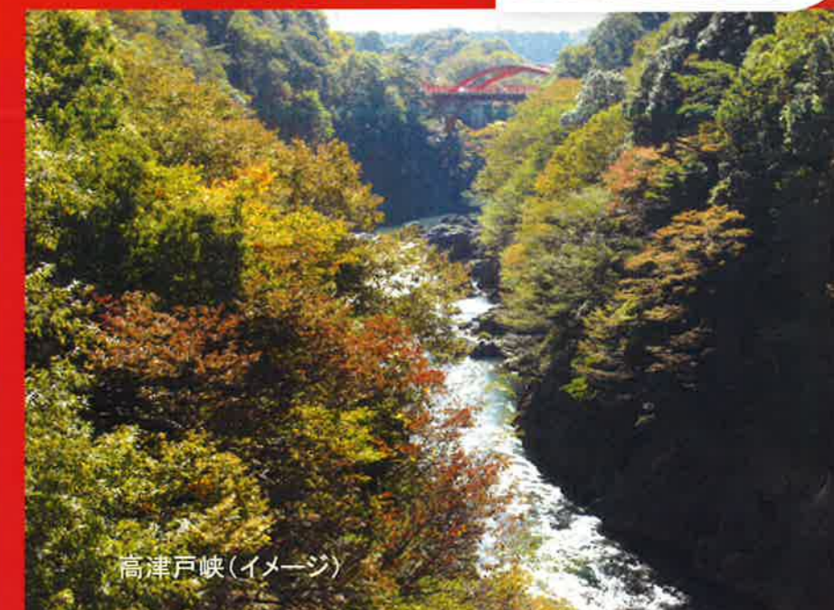
高津戸峡(イメージ)