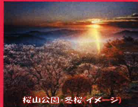
桜山公園・冬桜(イメージ)