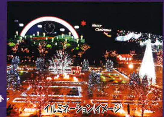
イルミネーション(イメージ)