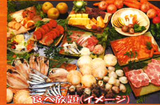
食べ放題(イメージ)