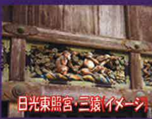
日光東照宮・三猿(イメージ)

出発日12/ 2(土)<青戸ルート> 青戸(08:30発) 出発日12/ 3(日)<八千代台ルート> 八千代台(08:10発)⇒勝田台(08:40発) 出発日12/10(日)<千葉ルート> 検見川浜(08:30発)⇒稲毛海岸(08:40発)⇒千葉(09:00発) 出発日12/ 9(土)<成田ルート> JR成田(08:00発)⇒公津の杜(08:10発)⇒京成酒々井(08:30発)⇒JR酒々井(08:40発) バス会社:千葉中央バス(12/2発)・千葉交通(12/3・12/9発)・千葉海浜交通(12/10発トイレ付バス)