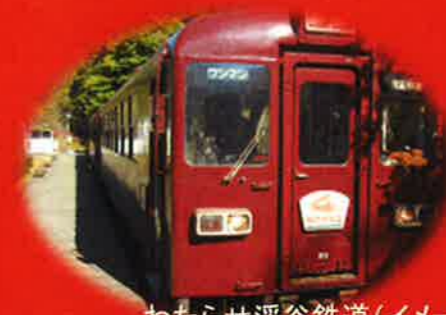
わたらせ渓谷鉄道(イメージ)

●コース案内 出発地～(東北道)～草木湖(車窓)～間藤駅(まとう)または足尾駅(あしお)+++++わたらせ渓谷鉄道の景色の一番美しいと言われる区間を乗車します>+++++沢入駅(そうり)～富弘美術館(見学)……草木ドライブイン(お買物)～高津戸峡(駐車場…神明宮…はねたき橋)～(東北道)～出発地(最終18:00～19:00頃着予定) ※道路状況により間藤駅または足尾駅からの乗車となり、選ぶことはできません。 ※わたらせ渓谷鉄道は座席指定ではありません。混雑時は立っての乗車となります。