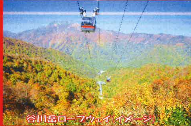
谷川岳ロープウェイ(イメージ)

出発日10/22(日)<八千代台ルート> 勝田台(07:30発)⇒八千代台(08:00発) 出発日10/29(日)<千葉ルート> 千葉(07:30発)⇒稲毛海岸(07:50発)⇒検見川浜(08:00発)⇒京成青砥(08:50発) 出発日10/28(土)<成田ルート> JR成田(07:30発)⇒公津の杜(07:40発)⇒京成酒々井(08:00発)⇒JR酒々井(08:10発) バス会社:千葉交通(10/22発)・千葉海浜交通(10/29発トイレ付バス)・千葉交通(10/28発)