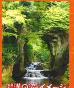
濃溝の滝(イメージ)

出発日11/26(日)<青戸ルート> 青戸(08:30発) 出発日11/25(土)<八千代台ルート> 八千代台(08:10発)⇒勝田台(08:40発) 出発日12/ 3(日)<千葉ルート> 検見川浜(08:30発)⇒稲毛海岸(08:40発)⇒千葉(09:00発) 出発日12/ 2(土)<成田ルート> JR成田(08:00発)⇒公津の杜(08:10発)⇒京成酒々井(08:30発)⇒JR酒々井(08:40発) バス会社:千葉中央バス(11/26発)・千葉交通(11/25・12/2発)・千葉海浜交通(12/3発トイレ付バス)